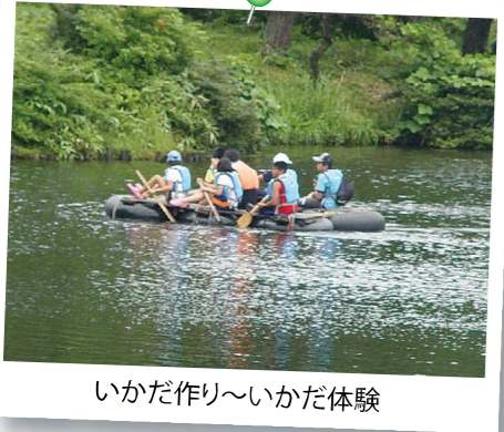
いかだ作り～いかだ体験