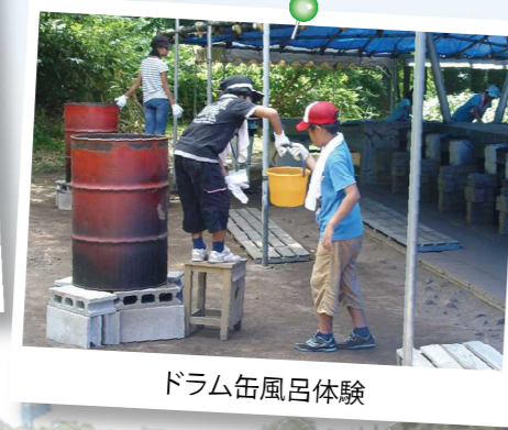
ドラム缶風呂体験